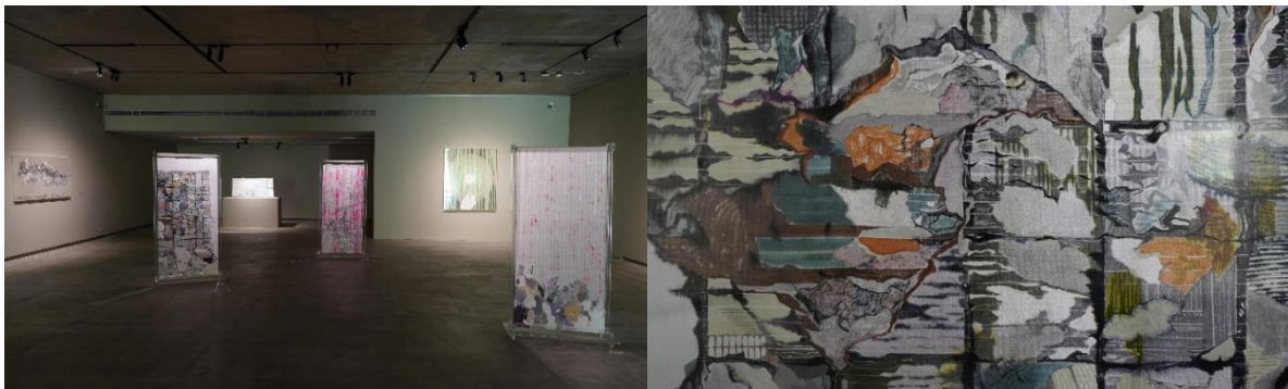
(左) 洪瑄_二樓展間作品