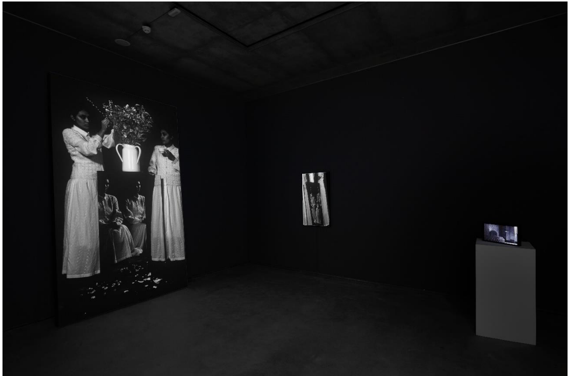
三樓展場照-日本藝術家澤拓作品