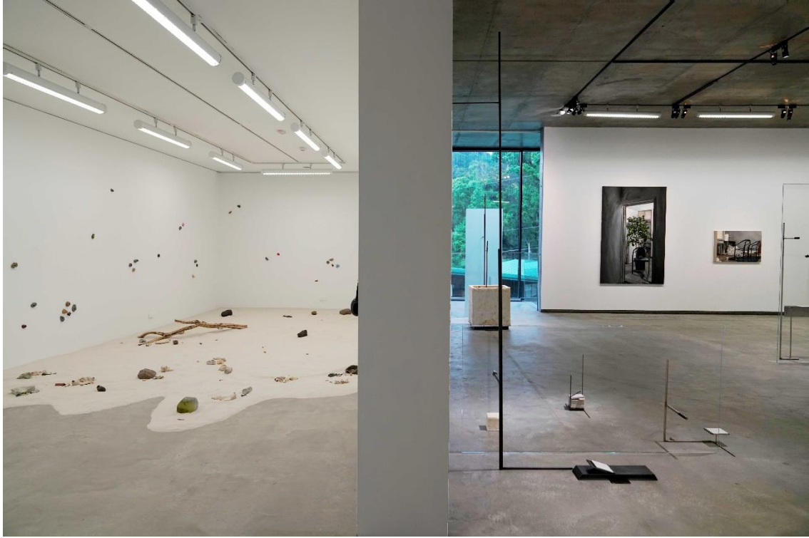
二樓展場照-台灣藝術家楊季涓、徐瑞謙、羅馬尼亞藝術家安娜·瑪瑞亞·米庫作品